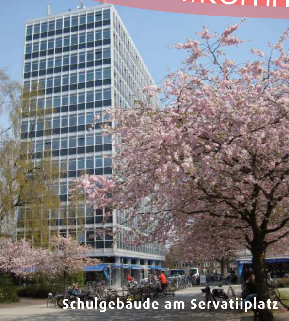
Schulgebäude am Servatiiplatz

Mit mehr als 60.000 Studierenden ist Münster eine der größten Universitätsstädte und einer der beliebtesten Studienorte Deutschlands. Junge Leute bestimmen den Lebensrhythmus der Stadt und schaffen eine besondere, lebendige Atmosphäre.